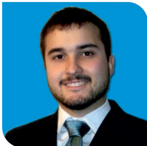
Director: Javier Del Río Arteaga, Geógrafo