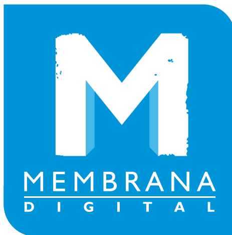
Comunicación y Diseño: Agencia Membrana Digital