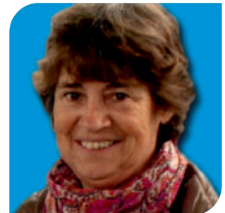
Director: María Teresa Juanicotena Sanzberro