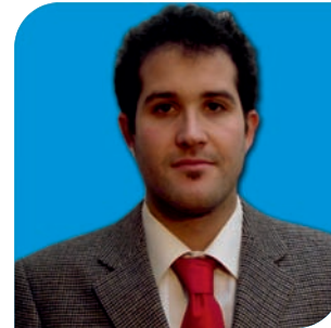
Director: Martín Del Río Arteaga, Psicólogo