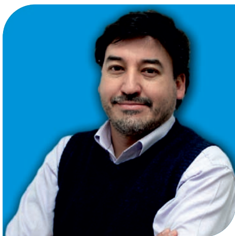
Director Ejecutivo: Manuel Escobar