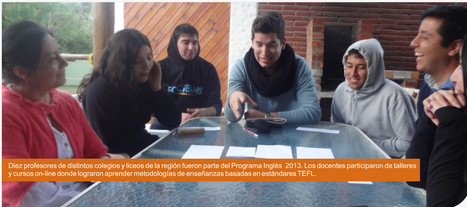
Diez profesores de distintos colegios y liceos de la región fueron parte del Programa Inglés 2013. Los docentes participaron de talleres y cursos on-line donde lograron aprender metodologías de enseñanzas basadas en estándares TEFL.