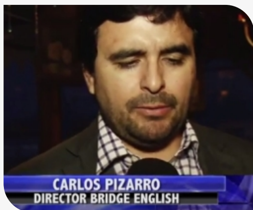
Programa Inglés ver video