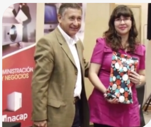
Programa "Aplica Diseño" ver video