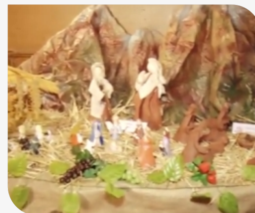
XII Exposición de Pesebres ver video