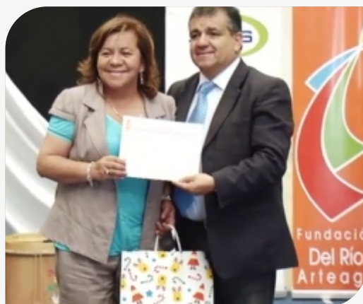
Internos de Huachalalume ver video