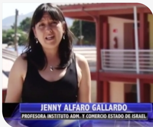
VII Concurso de Ideas de Negocio ver video

Durante el 2013 la Fundación Del Río Arteaga desarrolló diversos programas, los cuales han quedado registrados gracias a un trabajo en conjunto con la productora audiovisual DigitalPro.