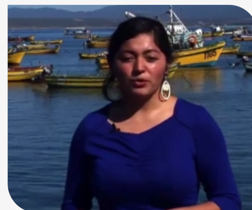
Ganadores 6º Concurso Ideas de Negocios ver video